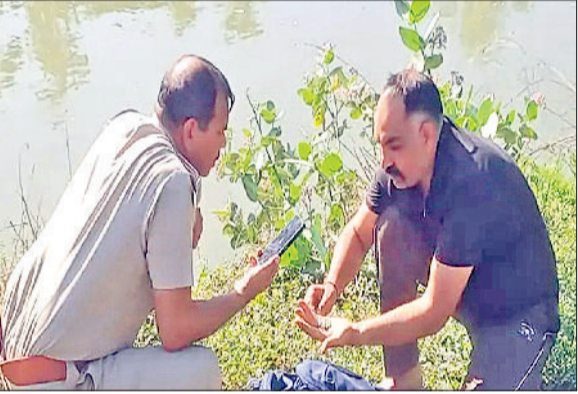
पानीपत। समालखा पुलिस नहर पर बरामद रिवाल्वर व कारतूस की जांच करते हुए।