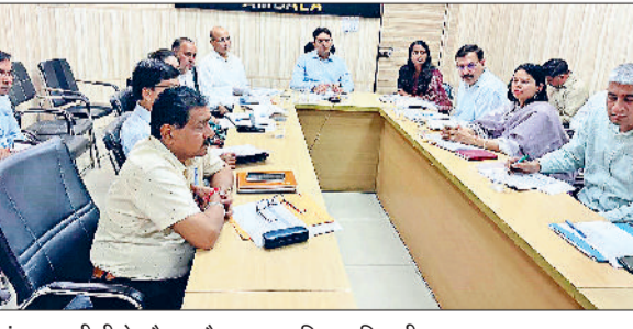
अंबाला। वीसी के दौरान मौजूद प्रशासनिक अधिकारी।

अंबाला में 1 लाख 14 हजार 722 एमटी गेहूं की खरीदी, 35147.2 का उठान