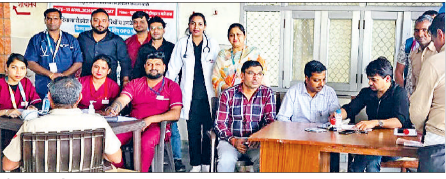
पानीपत। द किडनी हॉस्पिटल के डॉक्टरों रोडवेज बस स्टैंड पर कर्मियों का स्वास्थ्य जांचते हुए।

द किडनी हॉस्पिटल ने नए स्टैंड पर स्वास्थ्य जांच शिविर का आयोजन