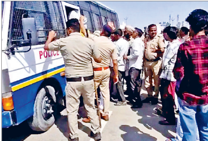
करनाल। प्रदर्शनकारियों को हिरासत में लेकर जाती पुलिस।

निश्चित स्थान पर बाबा साहेब का चित्र लगाकर पुष्प अर्पित किए गए थे। आरोप है कि देर रात अंधेरे का फायदा उठाकर किसी ने वहां से