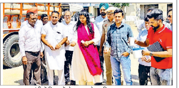
बराड़ा। अनाज मंडी में किसानों से बात करते हुए विधायक।